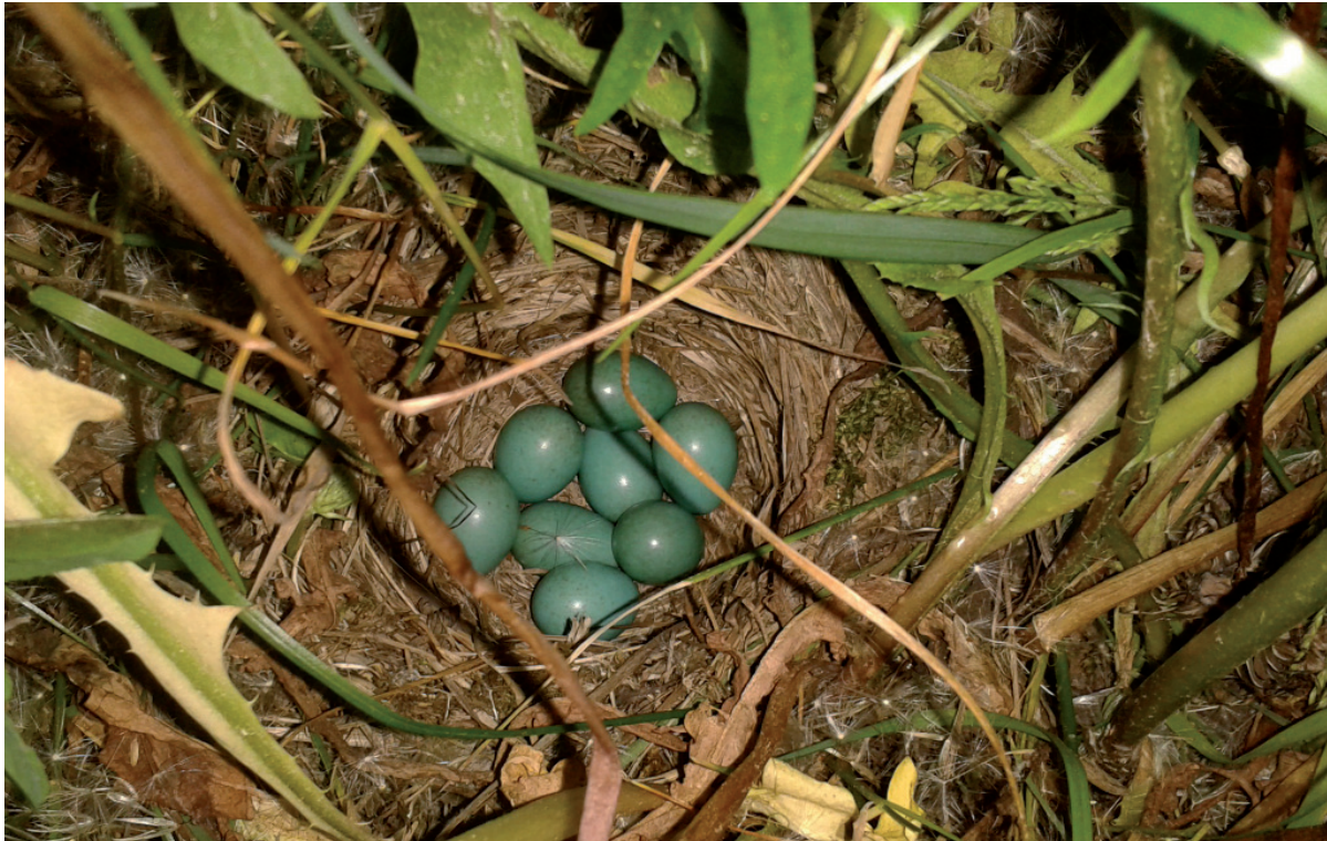
Abb. 3: Ein für Mitteleuropa sehr seltenes 8er-Gelege wurde am 29.05.2015 bei Neukirch festgestellt. - On 29 May 2015 there was found a nest with 8 eggs near Neukirch. This clutch size is very uncommon for Central Europe.

Bei zehn Vollgelegen der Erstbruten 2016 betrug die Gelegegrößen 2x 5, 7x 6 und 1 x 7 Eier. Bei den Nachgelegen wurde ein 4er- und ein 5er-Gelege festgestellt. Ein 8er-Gelege, wie am 29.05.2015 in Neukirch (Abb. 3), konnte 2016 nicht beobachtet werden. So bleibt dieses Gelege das bisher einzige mit 8 Eiern im Raum Kamenz.